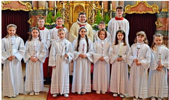
Erstkommunion in der Pfarrkirche St. Gangolf in Burggriesbach am 21.04.2024

Die Messe stand unter dem Motto "Du gehst mit!" Die Mädchen und Jungen gestalteten sie mit Fürbitten, Gebeten und dem Erneuern des Taufgelübdes mit.