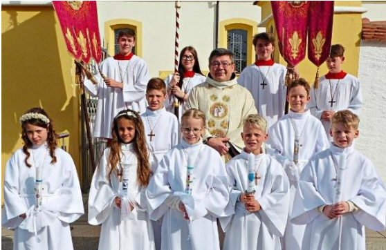
Erstkommunion in der Pfarrkirche St. Ägidius in Forchheim am 14.04.2024